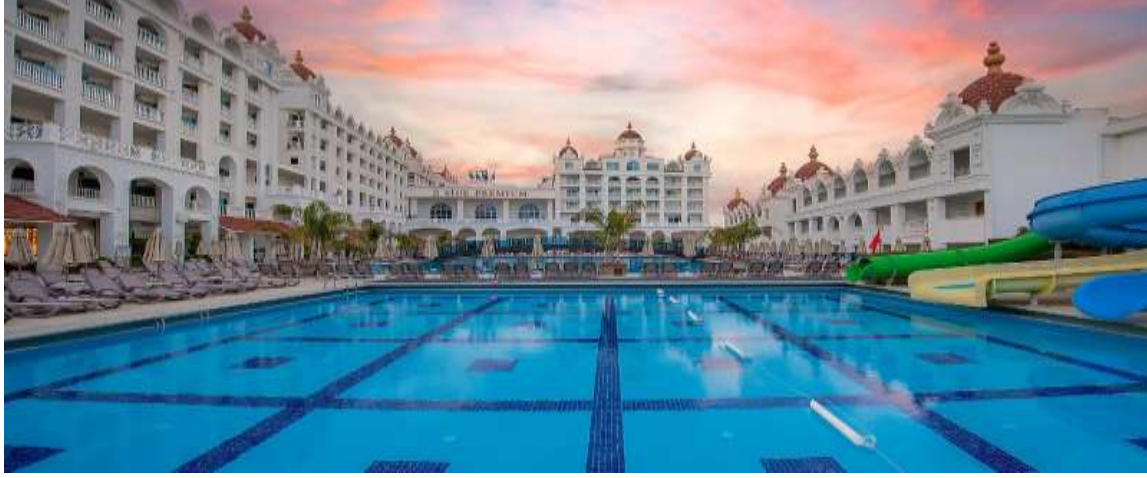
Oz Hotels Side Premium