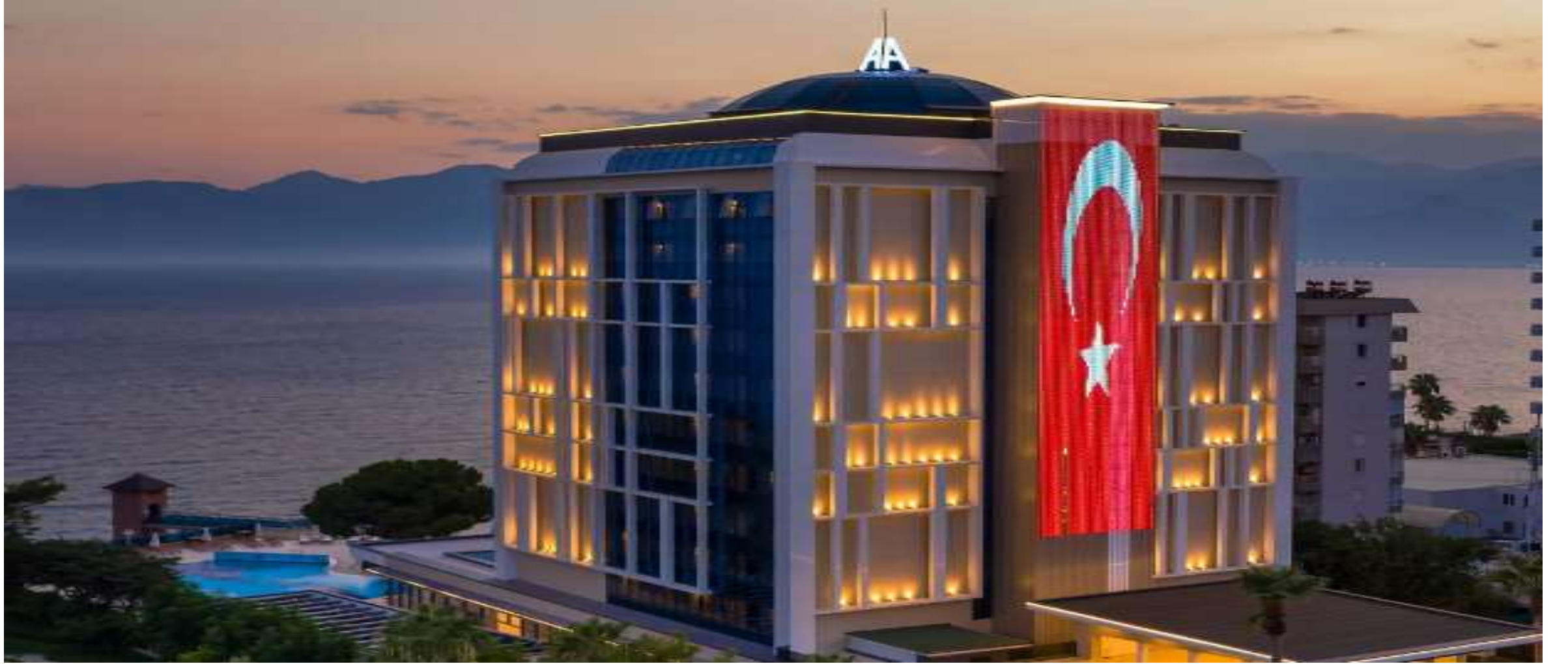
ÖZ HOTELS ANTALYA RESORT & SPA MURATPAŞA/ANTALYA