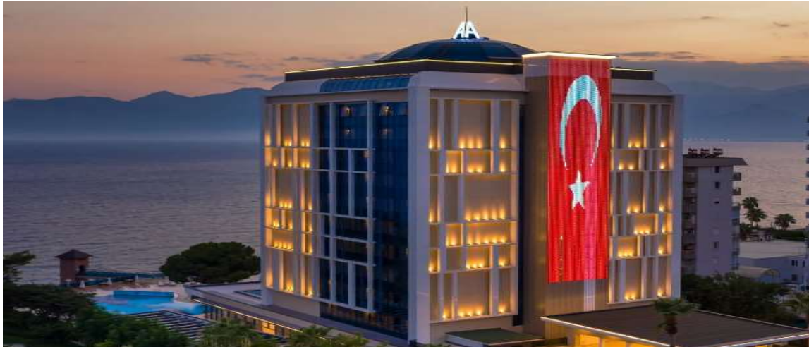
Oz Hotels Antalya Resort & Spa